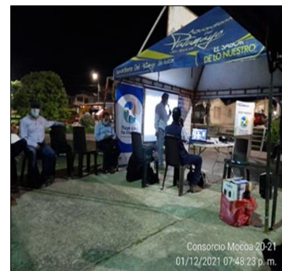
Lugar/Fecha: Cancha deportiva Barrio Los Prados-01 de diciembre de 2021 Actividad: Socialización