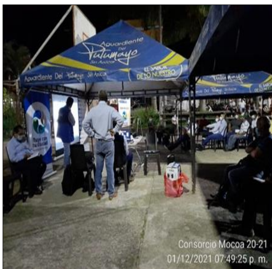
Lugar/Fecha: Cancha deportiva Barrio Los Prados-01 de diciembre de 2021 Actividad: Socialización