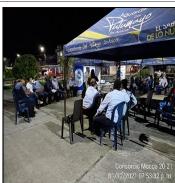
Lugar/Fecha: Cancha deportiva Barrio Los Prados-01 de diciembre de 2021 Actividad: Socialización