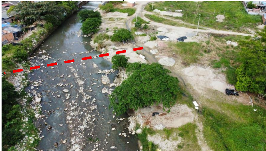
Imagen 3. Vista en planta cruce en río Mulato

EL perfil de tubería es similar al mostrado para el río Sangoyaco, las cajas de entrada y salida para ambos cruces se muestran a continuación: